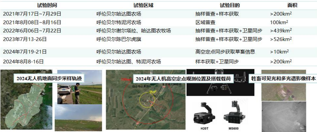
图 1 无人机牲畜数据获取试验情况